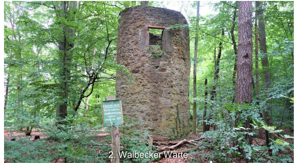
2. Walbecker Warte

Auf der Mesekenheide angekommen, ist es dann nur noch ein kurzes Stück ohne großen Anstieg zurück zum Ausgangspunkt der Tour an der Gedenkstätte Deutsche Teilung Marienborn.