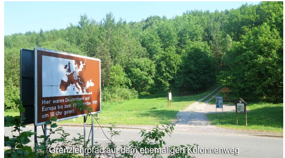
Grenzlehrpfad auf dem ehemaligen Kolonnenweg