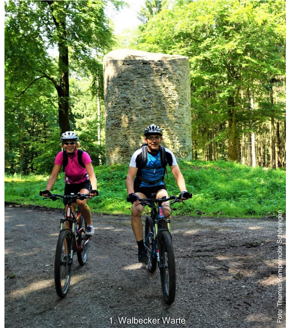
1. Walbecker Warte