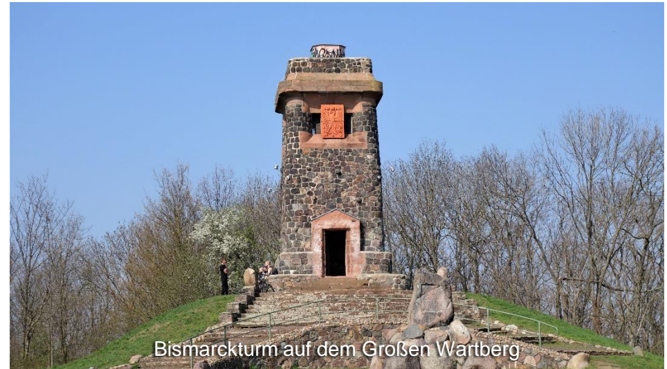
Bismarckturm auf dem Großen Wartberg

Über Irxleben verläuft die Tour weiter nach Hohenwarsleben und dann wieder zurück zum Ausgangspunkt in Niederndodeleben.