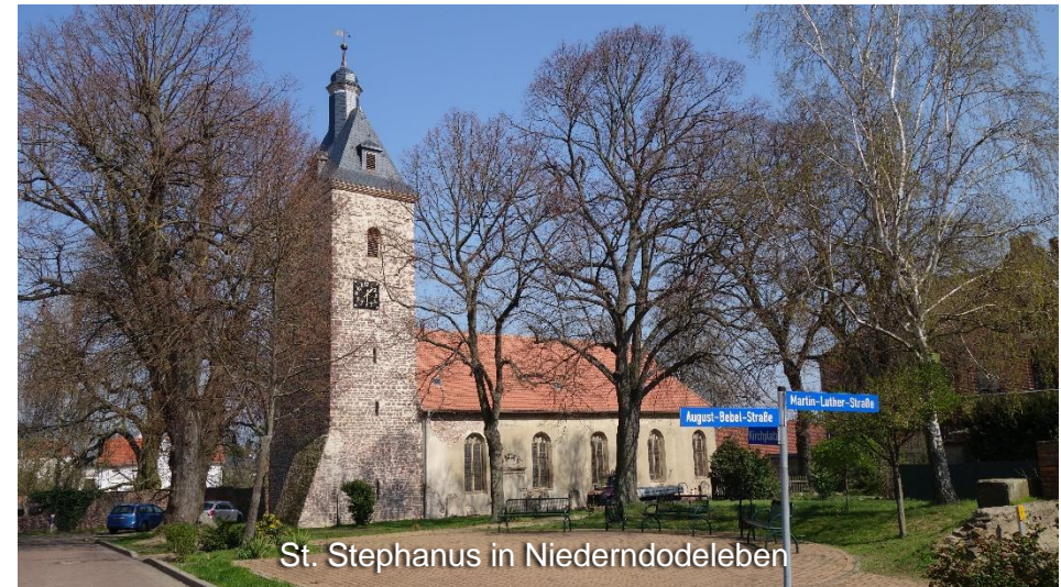
St. Stephanus in Niederndodeleben