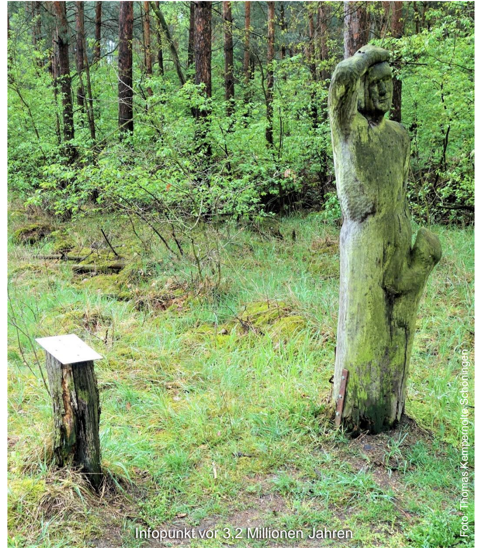
Infopunkt vor 3,2 Millionen Jahren