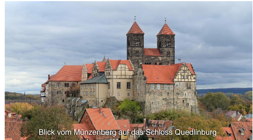
Blick vom Münzenberg auf das Schloss Quedlinburg