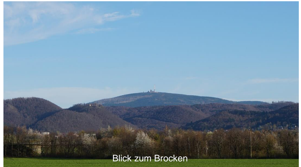
Blick zum Brocken