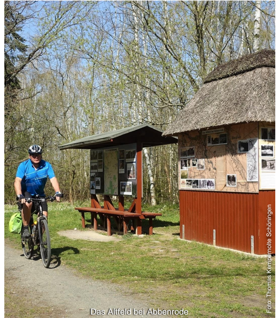
Das Altfeld bei Abbenrode