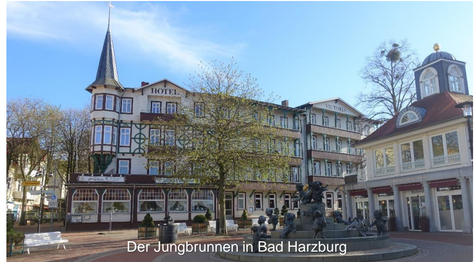
Der Jungbrunnen in Bad Harzburg

Zurück in Vienenburg liegen einige „Grenzerfahrungen“ hinter ihnen.