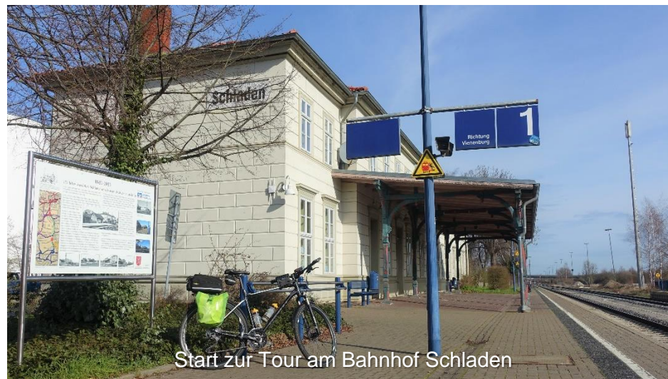
Start zur Tour am Bahnhof Schladen

Ist in Wolfenbüttel-Linden der Stadtrand von Wolfenbüttel erreicht, führt der Weg an der Oker entlang in die Innenstadt. Vorbei an Wasserturm, Stadtbad Okeraue und Lessingtheater erreichen Sie die Innenstadt, die zu einer Besichtigung und erholsamen Pause einlädt.