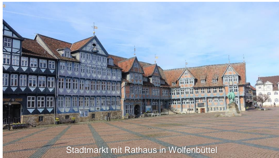
Stadtmarkt mit Rathaus in Wolfenbüttel

Am Okerufer entlang können Sie die letzten drei Kilometer der Rundtour genießen, indem Sie noch einen Blick auf die Infotafel der Telegraphenstation 22 und das Heimatmuseum „Alte Mühle“ werfen. Nachdem die Oker in Schladen überquert wurde, sind Sie quasi zurück am Ausgangspunkt der Tour, am Bahnhof Schladen, angekommen.