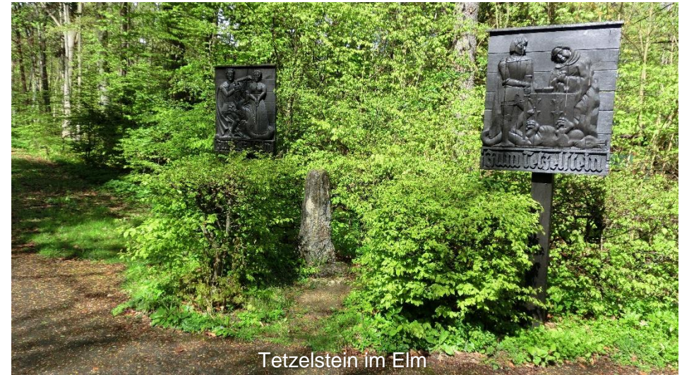
Tetzelstein im Elm