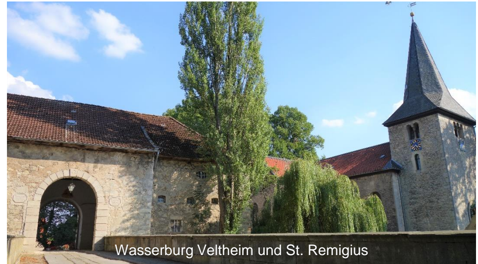
Wasserburg Veltheim und St. Remigius

Vorbei am Erlebnissteinbruch Markmorgen führt die Tour über Erkerode zum Rittergut Lucklum. Diese jahrhundertealte Gutsanlage mit Herrenhaus, Gutskirche, Wirtschafts- und Wohngebäuden sowie einem Landschaftspark lädt zu einer Besichtigung ein. Weiter geht es nach Veltheim, wo ein Abstecher zur Wasserburg mit der Kirche St. Remigius obligatorisch ist. Kurze Zeit später steht der Schlosspark Destedt auf dem Besichtigungsprogramm.