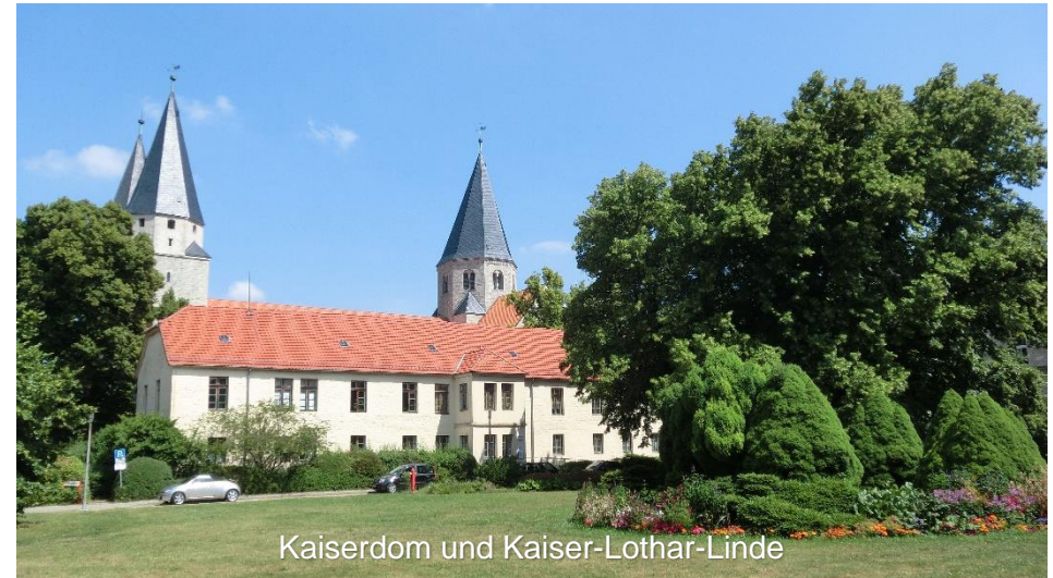
Kaiserdom und Kaiser-Lothar-Linde

Die Schlussetappe führt über den Hagenweg und die Küblinger Trift, mit einem herrlichen Blick auf das Harzvorland, zurück zum Ausgangspunkt der Tour nach Schöppenstedt.