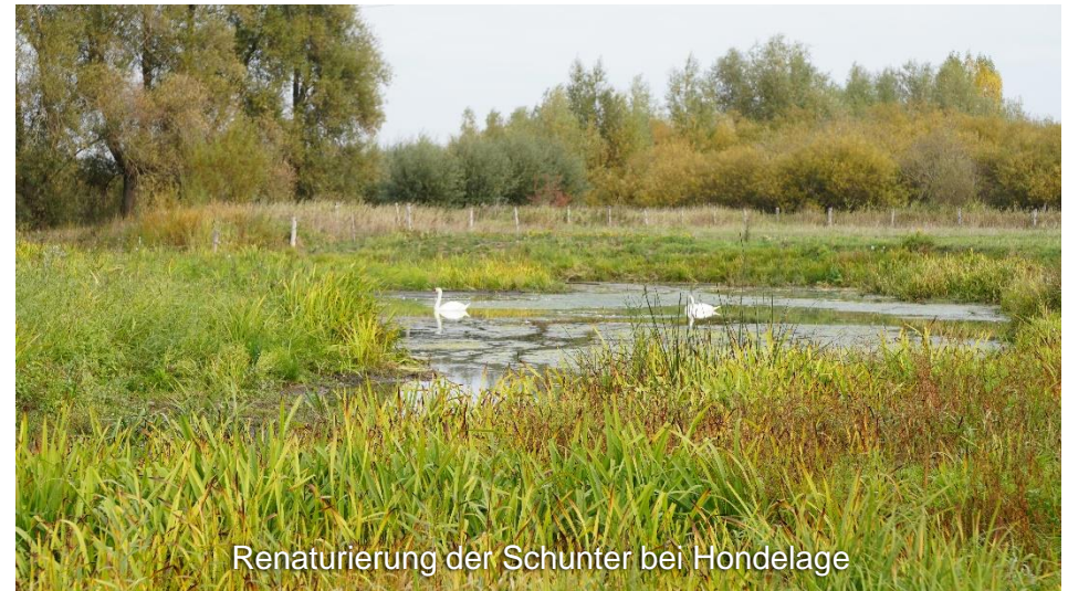
Renaturierung der Schunter bei Hondelage