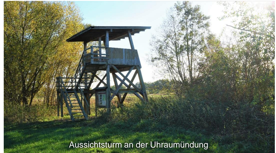
Aussichtsturm an der Uhraumündung

Immer nah der Schunter entlang führt der Weg jetzt in Richtung Elm. Der Freizeitpark Rábke wird rechts liegen gelassen und auf einem schmalen Pfad, der zum Schluss über eine Wiese führt, wird sie endlich erreicht: die Quelle der Schunter. Eine Infotafel, die sich im Bereich der größten Quelltöpfe befindet, gibt Ihnen umfassende Informationen zum Quellgebiet und zum Verlauf der Schunter, den Sie von der Mündung bis zur Quelle bereits hinter sich gebracht haben.