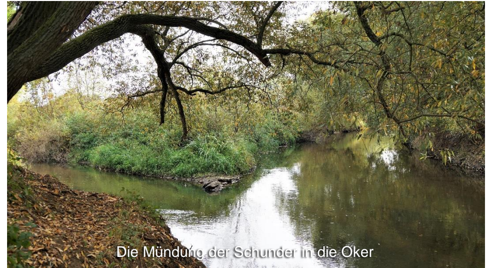
Die Mündung der Schunter in die Oker

Wenden wird durchfahren und anschließend schlängelt sich der Weg immer an der Schunter entlang vorbei an Mittelriede- und Wabemündung durch das grüne Braunschweig. Kurze Zeit später ist der Renaturierungsbereich der Schunter zwischen Dibbesdorf, Hondelage und Wendhausen erreicht. Infotafeln, die in diesem Bereich aufgestellt sind, geben umfassende Informationen über die hier durchgeführte