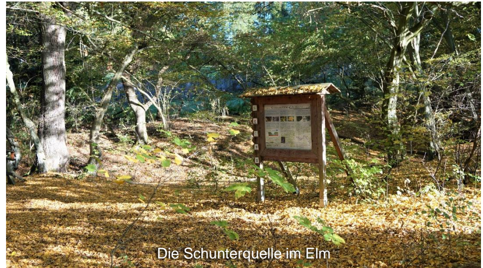
Die Schunterquelle im Elm