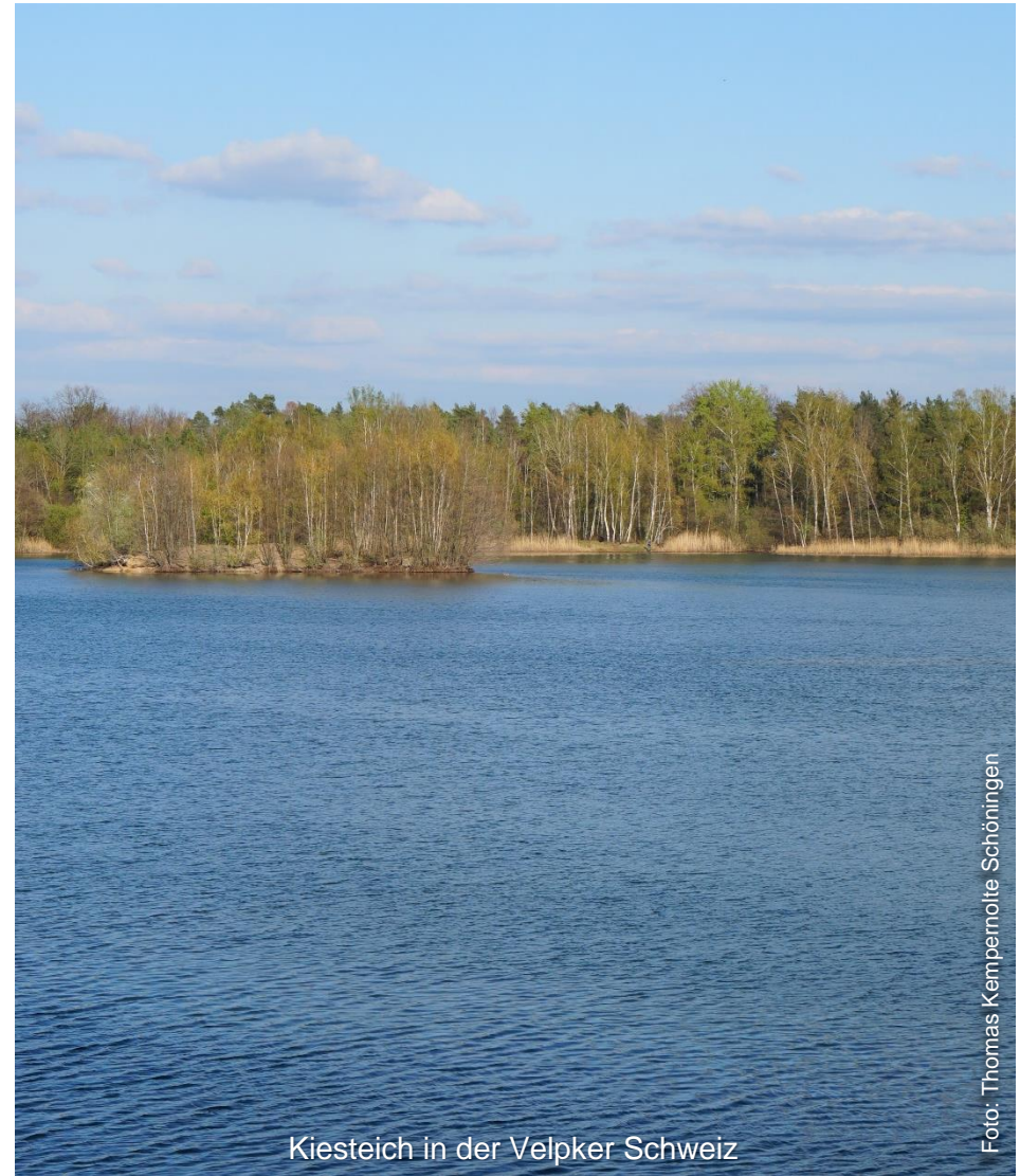
Kiesteich in der Velpker Schweiz