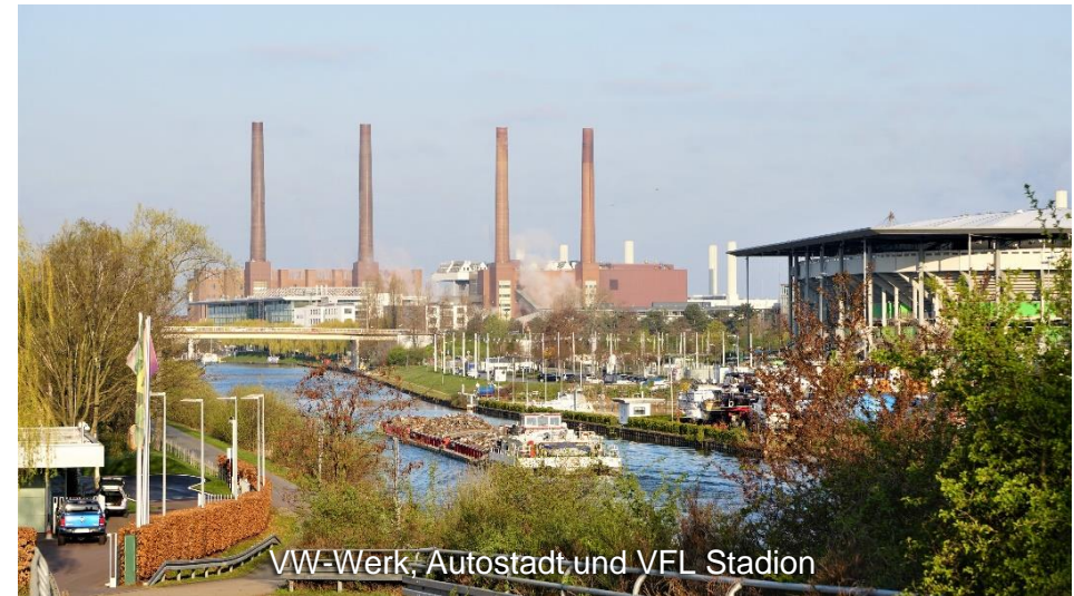
VW-Werk, Autostadt und VFL Stadion