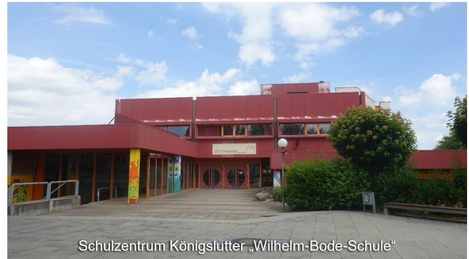
Schulzentrum Königslutter „Wilhelm-Bode-Schule“