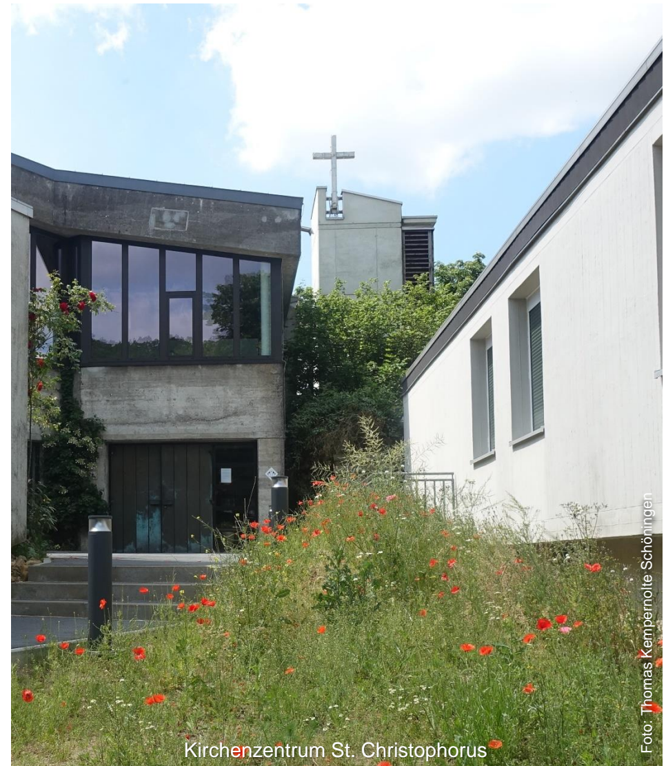
Kirchenzentrum St. Christophorus