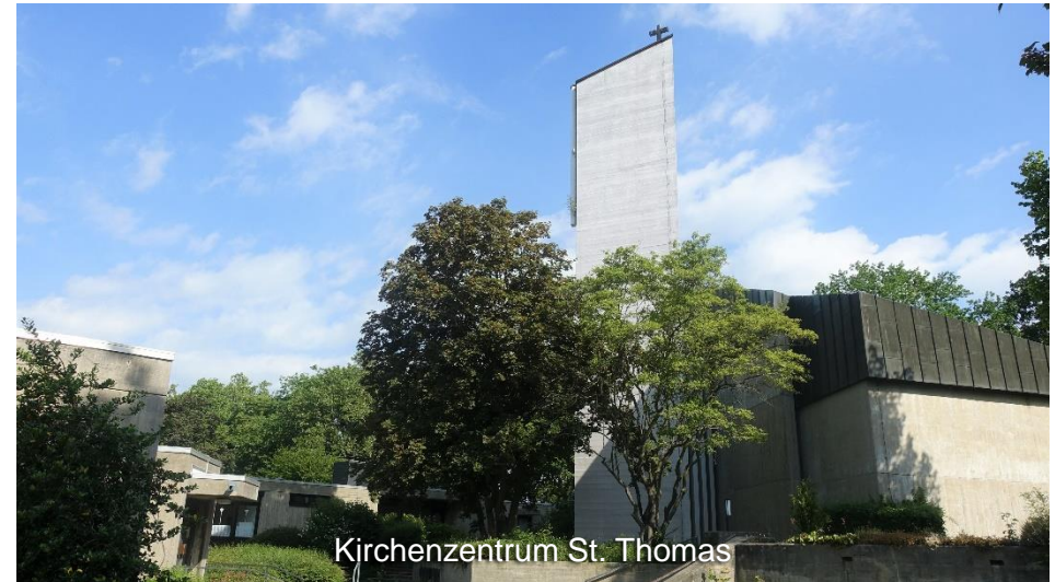
Kirchenzentrum St. Thomas

Vorbei am von weitem sichtbaren Kaiserdom verläuft die Strecke anschließend durch die historische Innenstadt in Königslutters Norden.