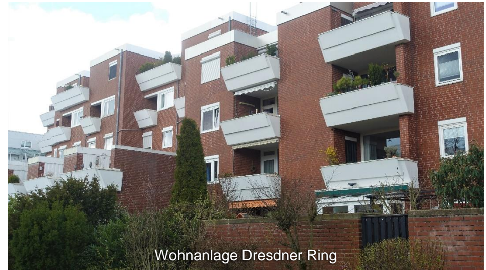
Wohnanlage Dresdner Ring