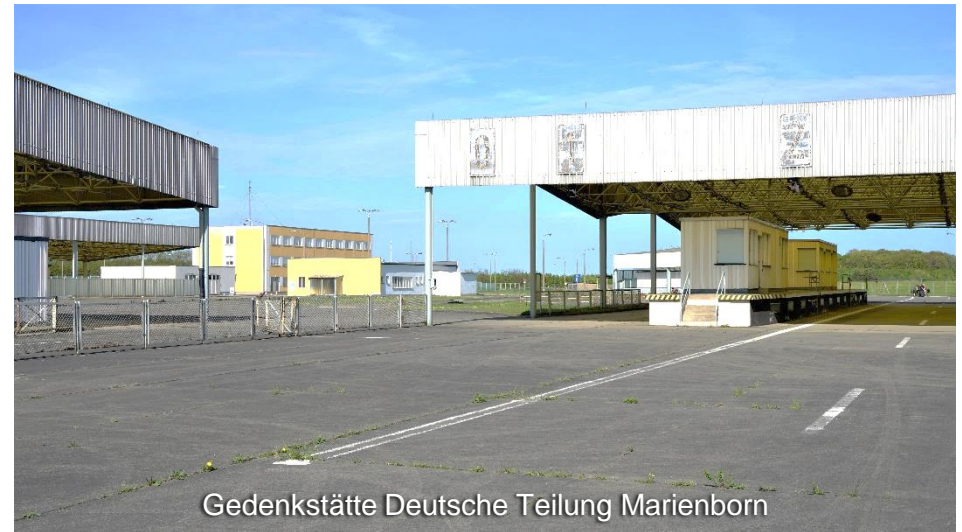
Gedenkstätte Deutsche Teilung Marienborn