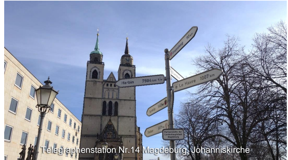
Telegraphenstation Nr. 14 Magdeburg, Johanniskirche

Der kurze Abstecher zum Heeseberg mit seinem Aussichtsturm eröffnet Ihnen einen weiten Blick in das ehemalige Grenzgebiet und im Nordosten können Sie schon Schöningen, das nächste Etappenziel, erkennen.