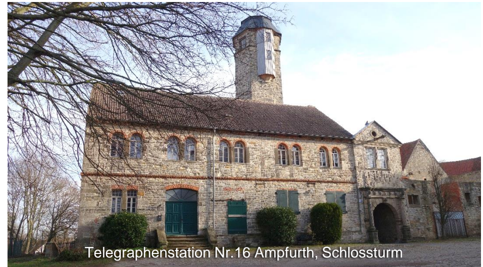
Telegraphenstation Nr. 16 Ampfurth, Schlossturm