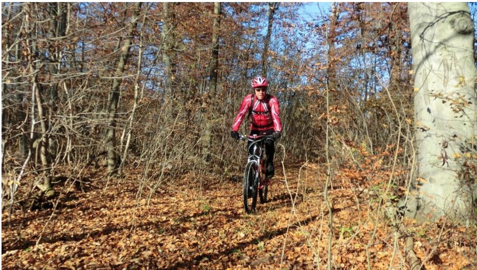
Trail nach Aspenstedt