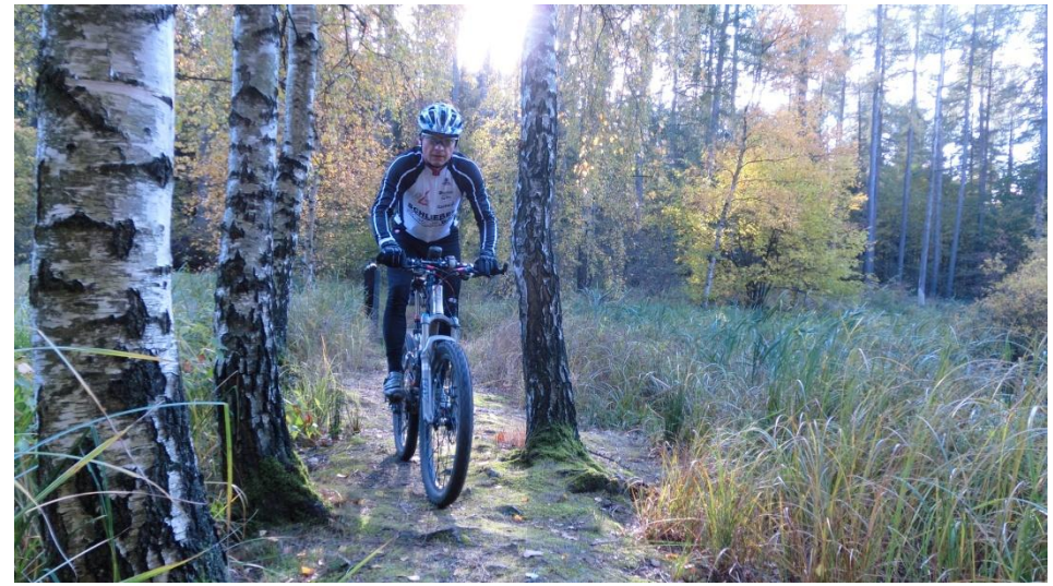
An den Collyteichen