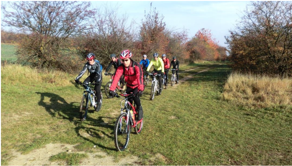
Anstieg von Badersleben in den Huy