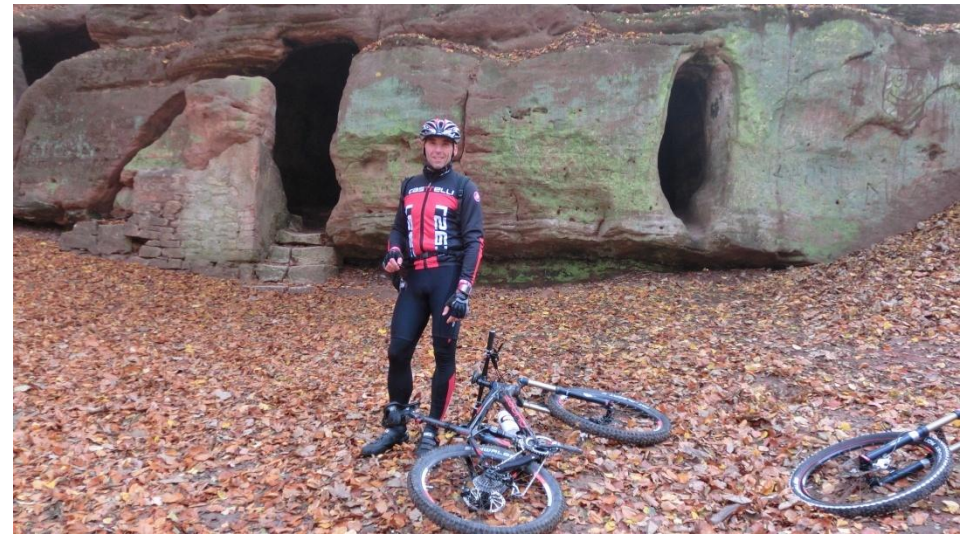
An der Daneilshöhle