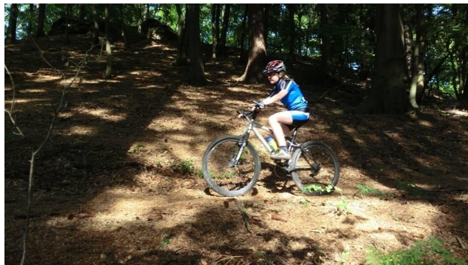
Trail vom Jägerhaus zurück zum Wohldenberg