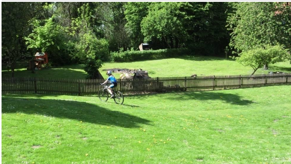
Am Garten des Pfarrhauses beginnt der historische Weg