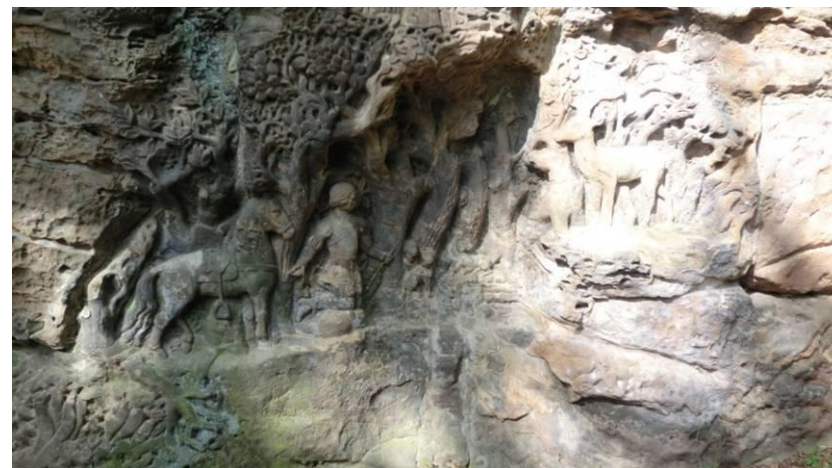
Relief mit dem Heiligen Hubertus am Jägerhaus