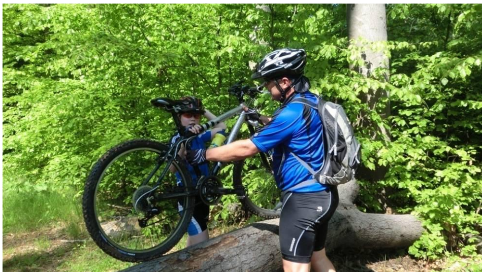
Hindernisse werden gemeinsam bewältigt