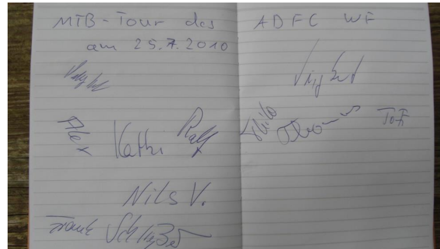
Der Eintrag im Gipfelbuch am Eilumer Horn.