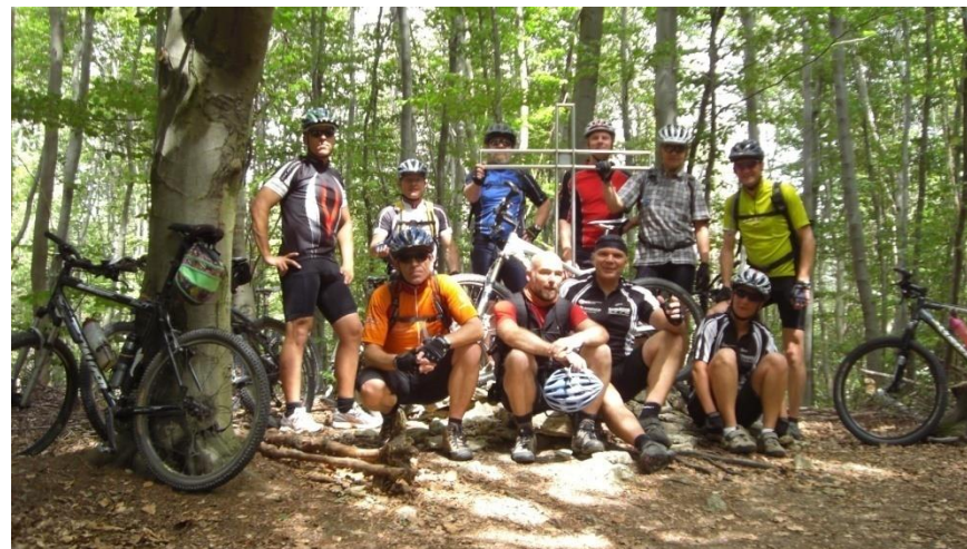
Der höchste Punkt im Elm, das Eilumer Horn.