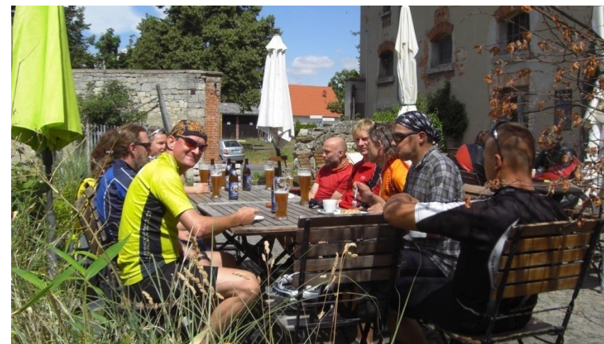
Die zweite Pause in der Wegwarte in Lucklum.