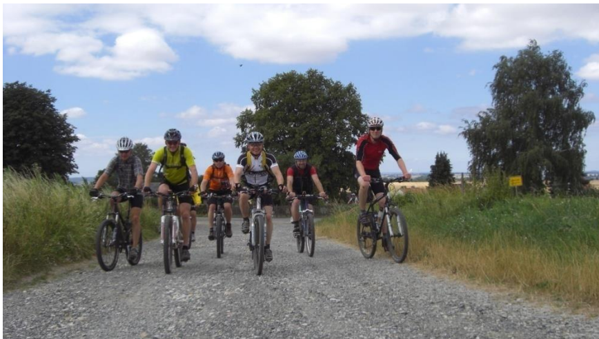
Die erste Steigung von Erkerode in den Elm.