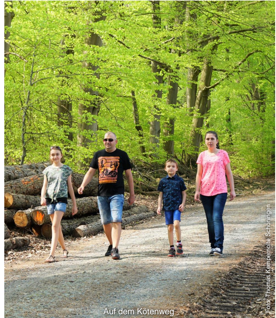
Auf dem Kötenweg