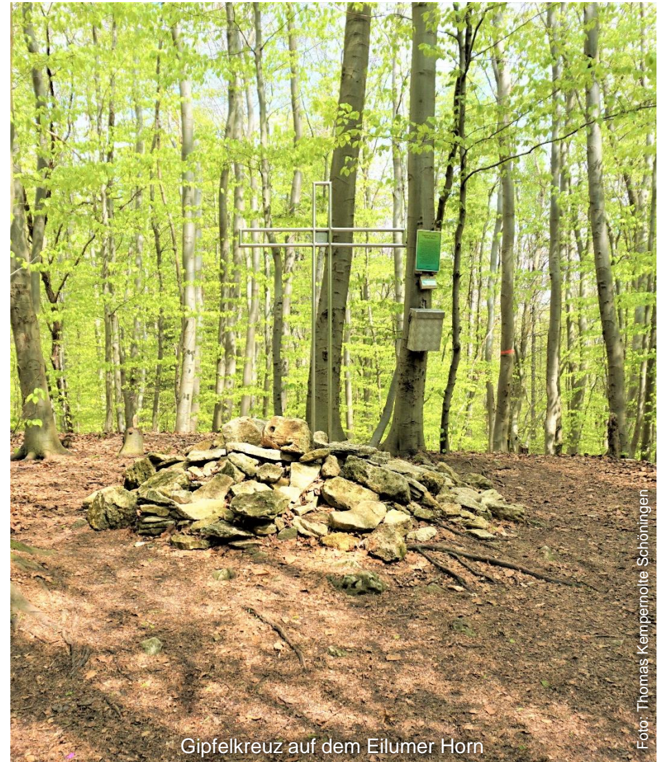
Gipfelkreuz auf dem Eilumer Horn