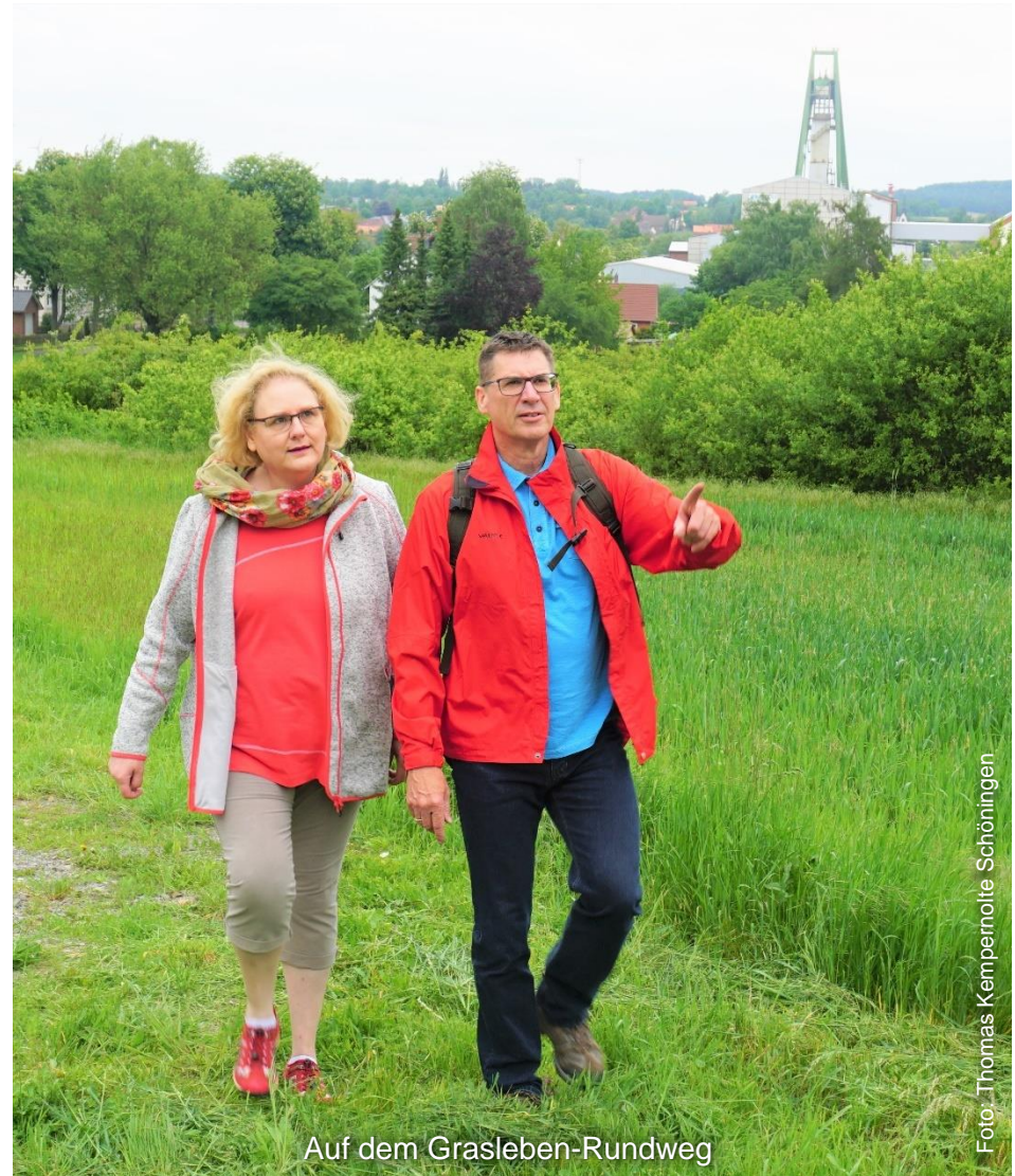
Auf dem Grasleben-Rundweg