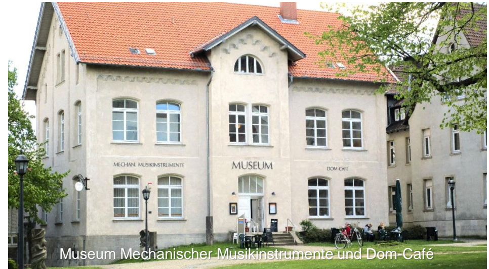
Museum Mechanischer Musikinstrumente und Dom-Café