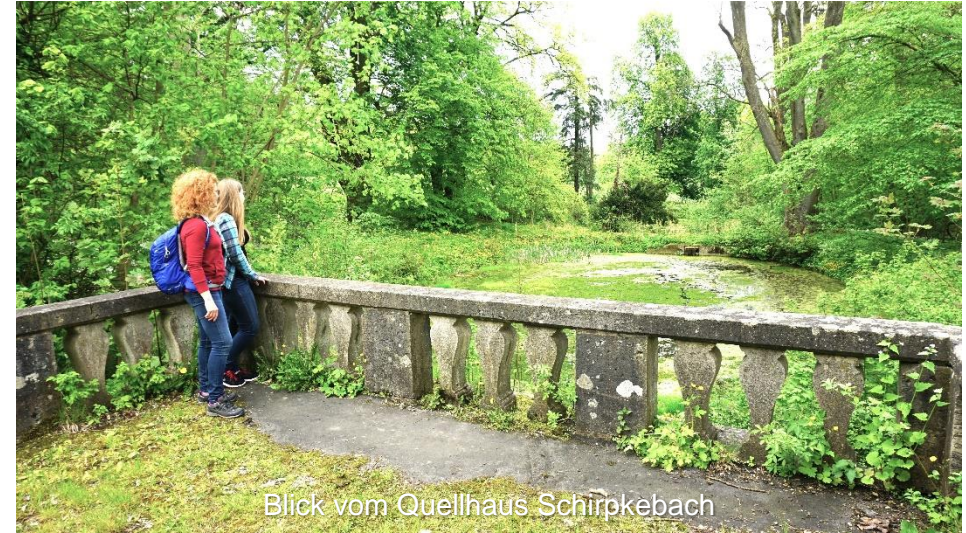
Blick vom Quellhaus Schierpkebach