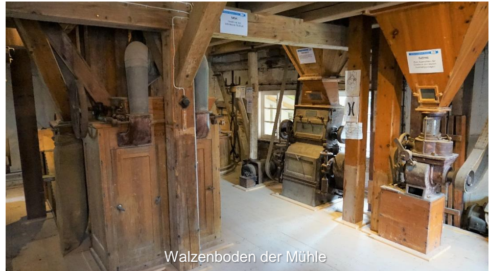
Walzenboden der Mühle