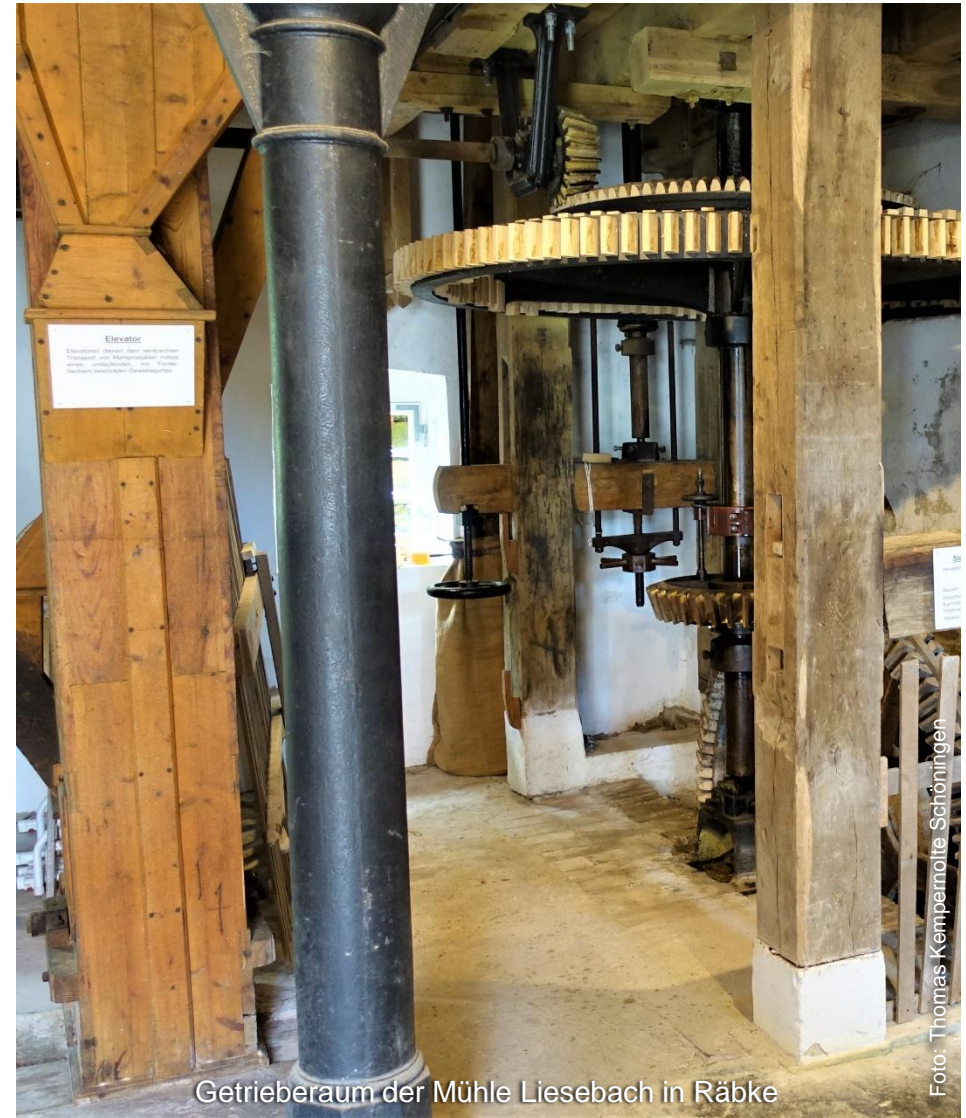
Getrieberaum der Mühle Liesebach in Rábke