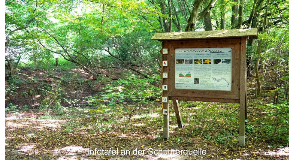
Infotafel an der Schunterquelle

Um den regelmäßigen Mühlenbetrieb zu sichern, wurde die Schunter auch zu Teichen aufgestaut. Einen dieser Teiche, den Schuntersee mit dem dahinterliegenden Freibad Rábke, erreicht ihr auf dem weiteren Weg in Richtung des Mühlendorfes.