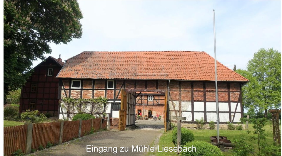
Eingang zu Mühle Liesebach