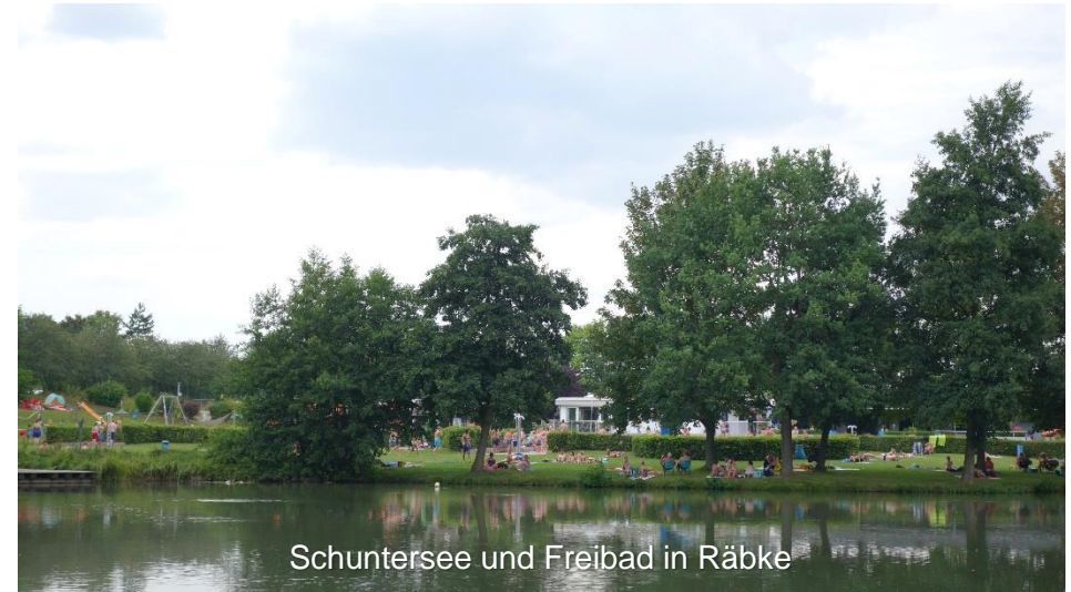
Schuntersee und Freibad in Rábke