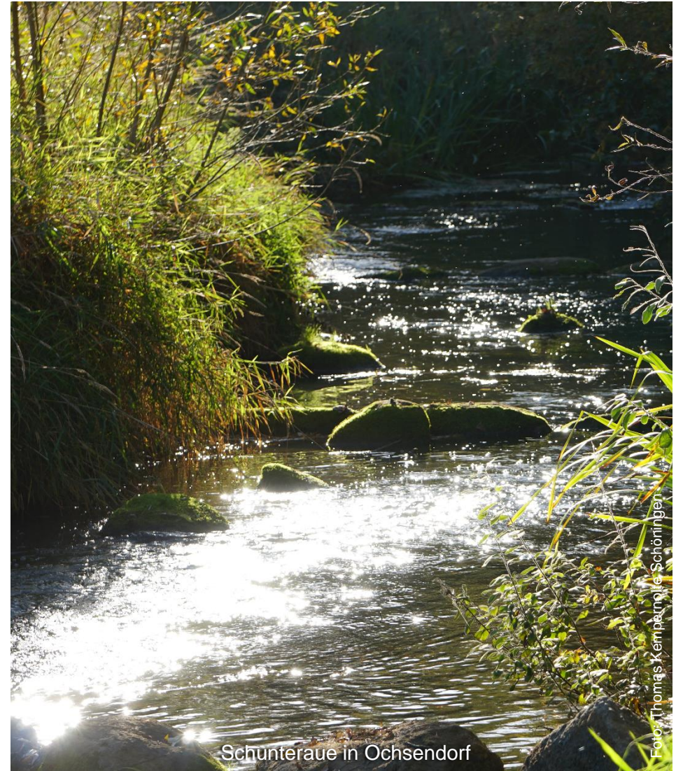
Schunterraue in Ochsendorf