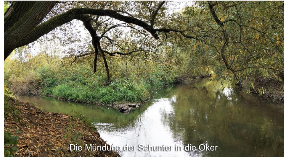
Die Mündung der Schunter in die Oker

Wenden wird durchfahren und anschließend schlängelt sich der Weg immer an der Schunter entlang vorbei an Mittelriede- und Wabemündung durch das grüne Braunschweig. Kurze Zeit später ist der Renaturierungsbereich der Schunter zwischen Dibbesdorf, Hondelage und Wendhausen erreicht. Infotafeln, die in diesem Bereich aufgestellt sind, geben umfassende Informationen über die hier durchgeführte