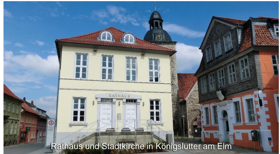
Rathaus und Stadtkirche in Königslutter am Elm