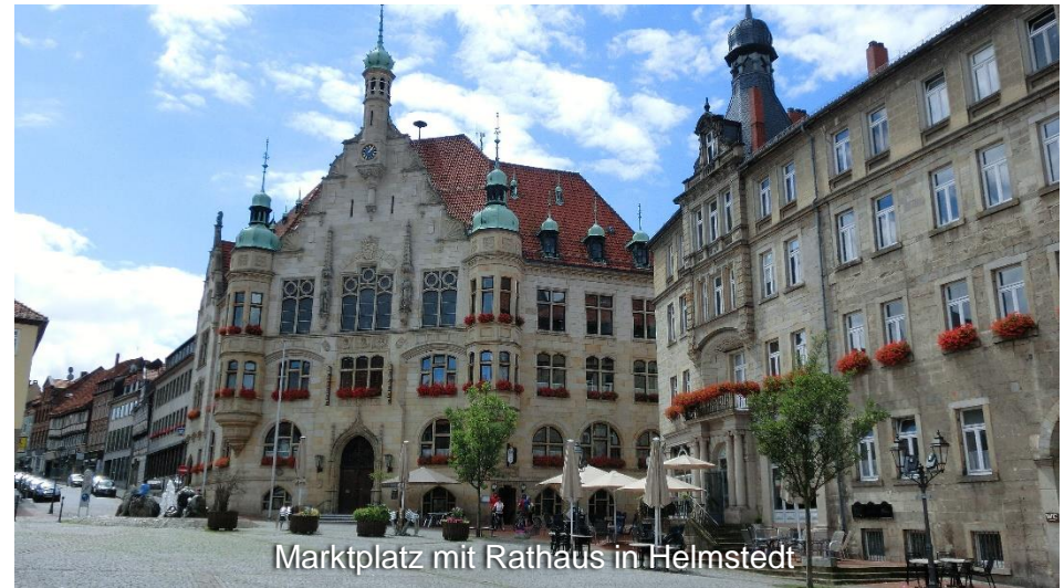
Marktplatz mit Rathaus in Helmstedt

Die letzte Tagesetappe verläuft über Ochsendorf nach Hattorf und kurz darauf ist am Detmeroder Teich schon der Stadtrand von Wolfsburg erreicht. Durch das „grüne Wolfsburg“ kommen Sie nun zurück zum Ausgangspunkt der Tour am Rathaus in der Porschestraße.