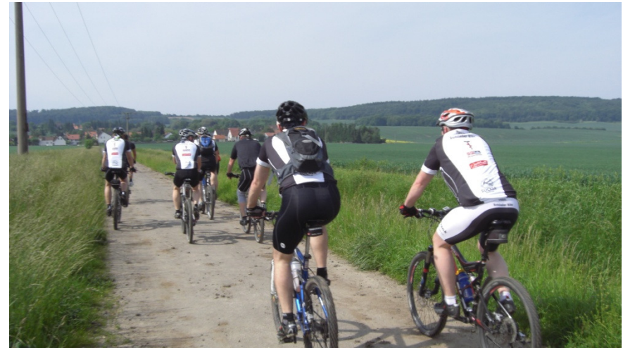
In Richtung Groß Vahlberg