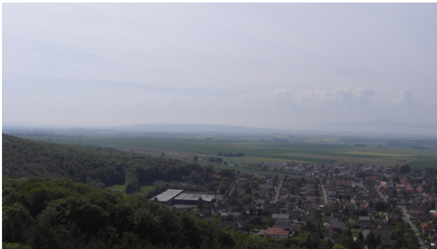
Blick vom Bismarckturm