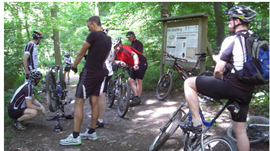
Fahrradreparatur an der Asseburg