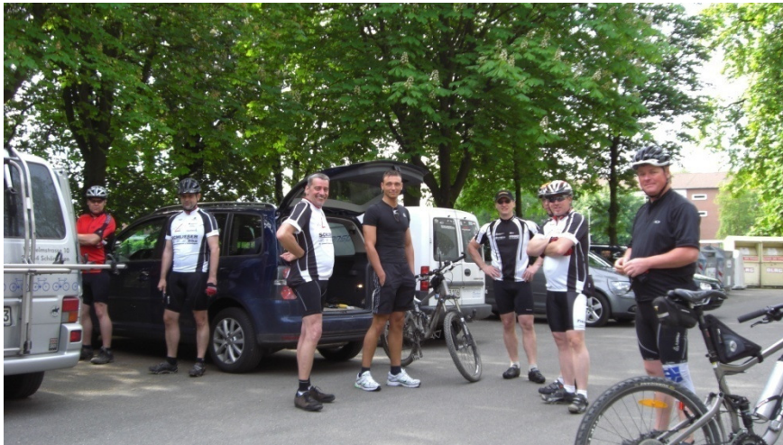
Start am Schwimmbad in Schöppenstedt