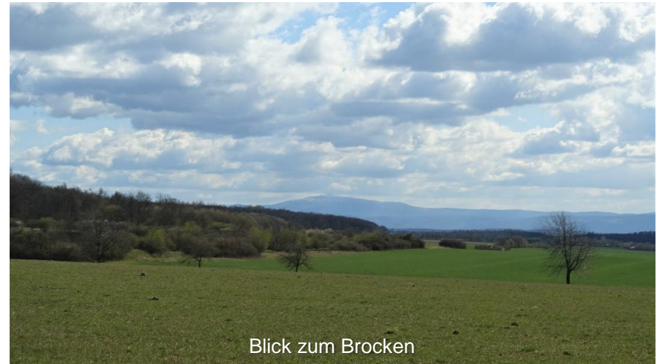
Blick zum Brocken