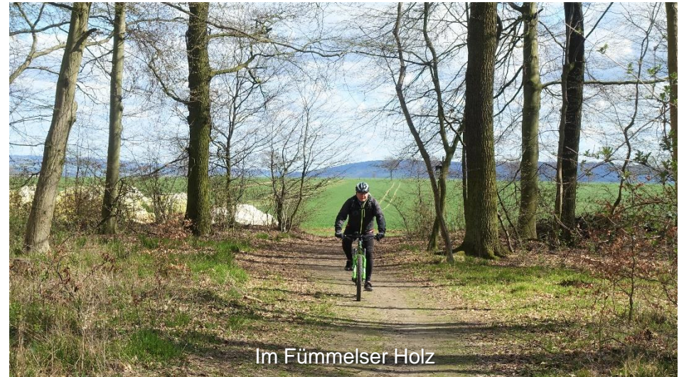
Im Fümmler Holz

Bevor das eigentliche Ziel der Tour, die „Blaue Lagune“ erreicht ist, folgt noch ein kurzer Abstecher zur Schalksburg. Von der ehemaligen Höhenburg ist heute nur noch die Wallanlage mit einem unregelmäßigen Durchmesser von 100 bis 120 Metern zu erkennen.