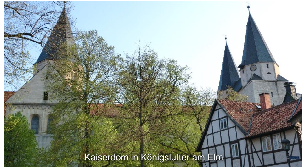
Kaiserdom in Königslutter am Elm

Entlang der Lutter gelangen Sie nun wieder in den Elm, erreichen am Lutterspring das Quellhaus der Lutter und beginnen hier den Aufstieg zum Tetzelsstein. Der Stein erinnert an den Ablassprediger Johann Tetzel, der der Sage nach hier vom Ritter Hagen erschlagen worden ist. Auf dem Areal der beliebten Waldgaststätte Tetzelsstein finden Sie noch das Tetzels-Denkmal, die zweitälteste Bergsportanlage Deutschlands und eine Installation aus dem Buch Till Eulenspiegels.