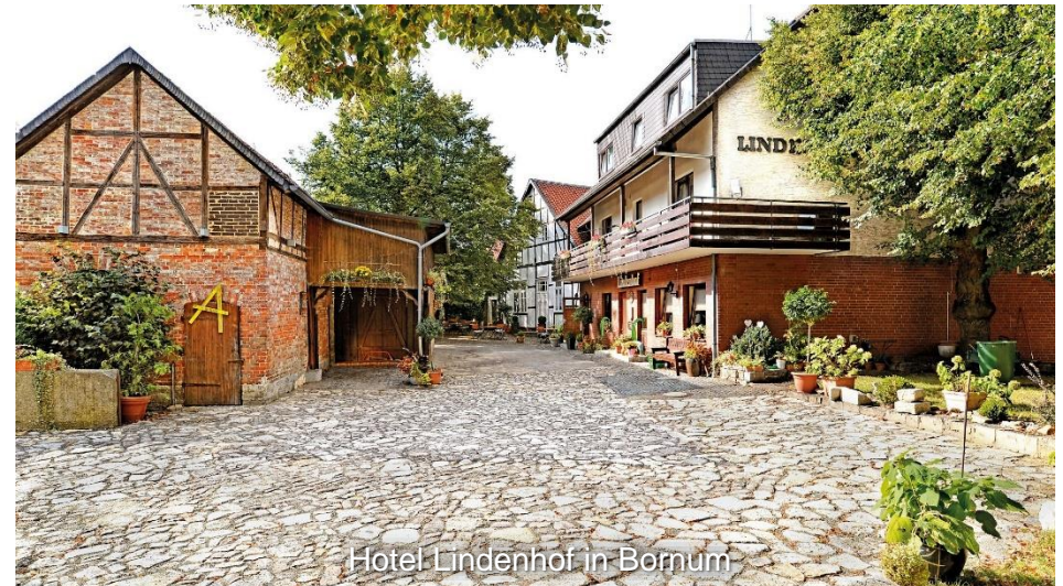
Hotel Lindenhof in Bornum