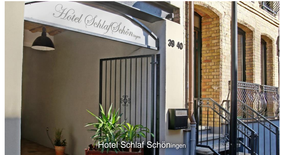
Hotel Schlaf Schöningen